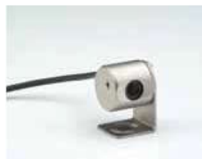
Держатель из нержавеющей стали