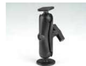
RAM - Держатель монитора