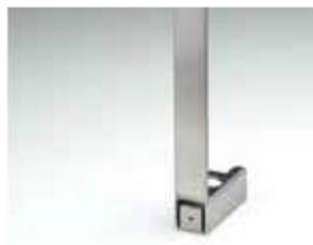
Монтажный крепеж для вилки