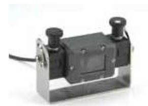
Набор быстросъемных держателей