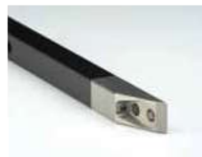
Удлинитель для камеры