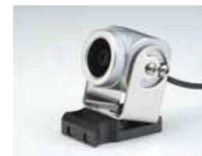
Набор быстросъемных держателей