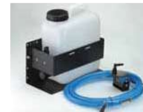
Система очистки под высоким давлением