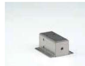
Монтажный крепеж для вилки