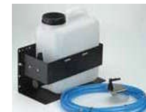
Система очистки под высоким давлением